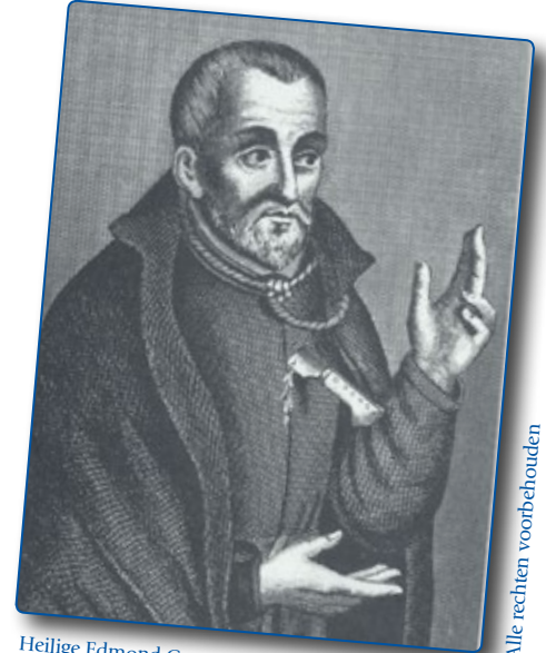
Heilige Edmond Campion

L ONDEN, 20 november 1581. De jury heeft zojuist haar vonnis geveld: Pater Edmond Campion en meerdere medeplichtigen worden schuldig bevonden aan hoogverraad en veroordeeld tot ophanging en het aan stukken snijden van hun lichaam. Campion zingt zijn vreugde uit: « Te Deum laudamus, Te Dominum confitemur » (U, God, loven wij. U, Heer, prijzen wij). Zijn confrater Sherwin vervolgt: « Hæc est dies quam fecit Dominus, exultemus et lætemur in ea » (Dit is de dag die de Heer heeft gemaakt, wij zullen hem vieren in blijdschap). Waardig en met sereen gelaat, verklaart Campion in ieders naam: «Het is niet de dood die wij vrezen. Wij weten dat wij geen meester zijn van ons leven... Dit is het enige dat wij nu te zeggen hebben: door ons te veroordelen, veroordeelt u uw eigen voorouders – alle voormalige priesters, bisschoppen en koningen – al wie voorheen tot de glorie van Engeland behoorden, het eiland van de heiligen, het meest toegewijde kind van de Stoel van Petrus. Wat hebben wij trouwens verkondigd – ook al geeft u het de onuitstaanbare naam “verraad” – wat zij al niet verkondigd hadden? Veroordeeld worden omdat wij gesproken hebben zoals die grote lichten – niet alleen van Engeland, maar van de hele wereld – is voor ons zowel een vreugde als een eer».