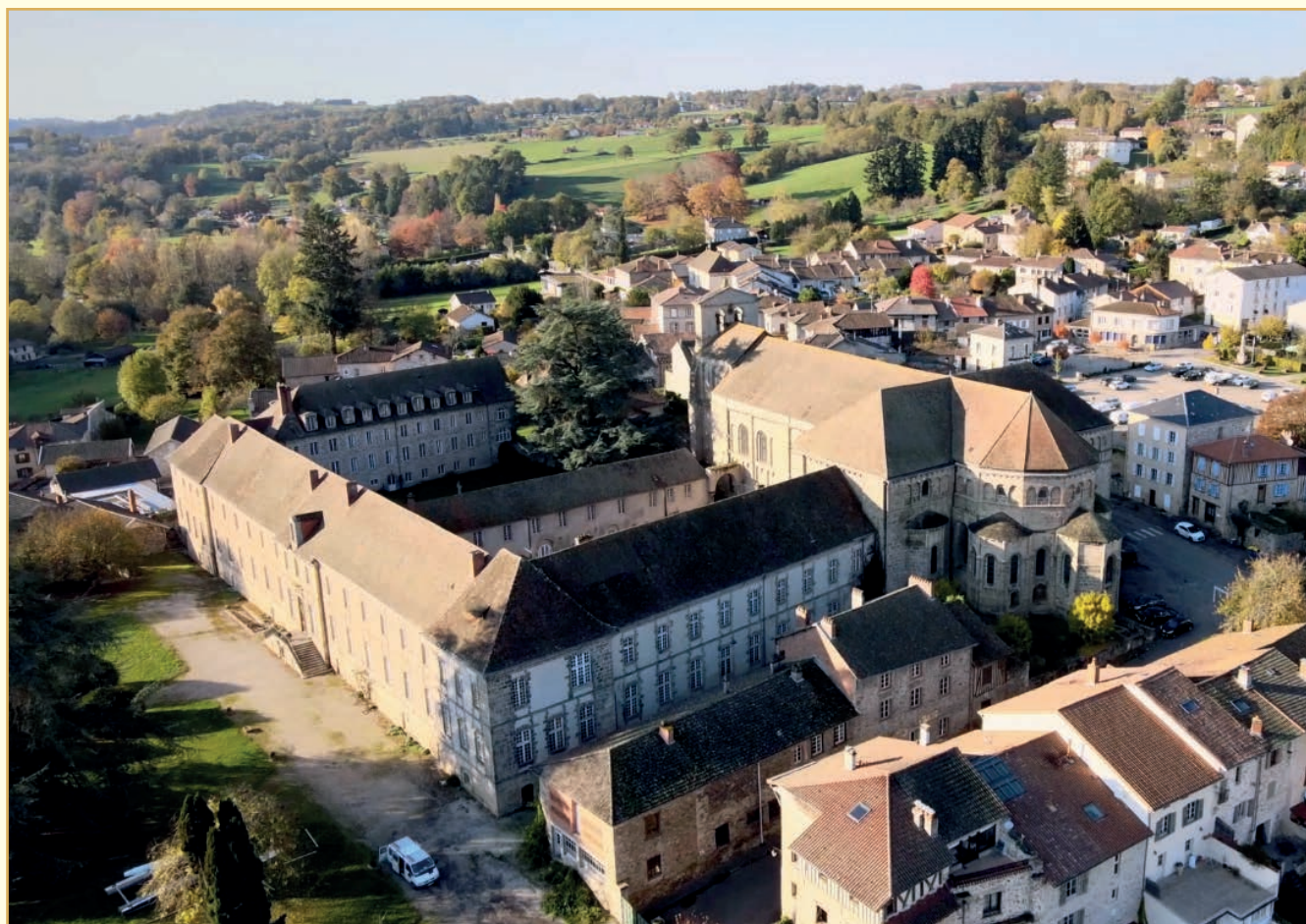
Los edificios de la abadía de Solignac