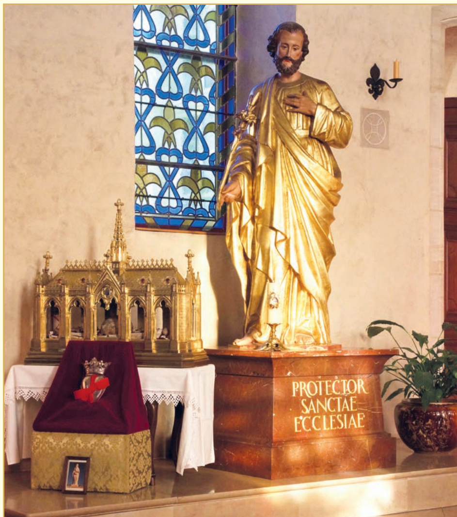
Las reliquias de Santa Reina

adicional. Se llamará “Casa Sainte-Chantal”.