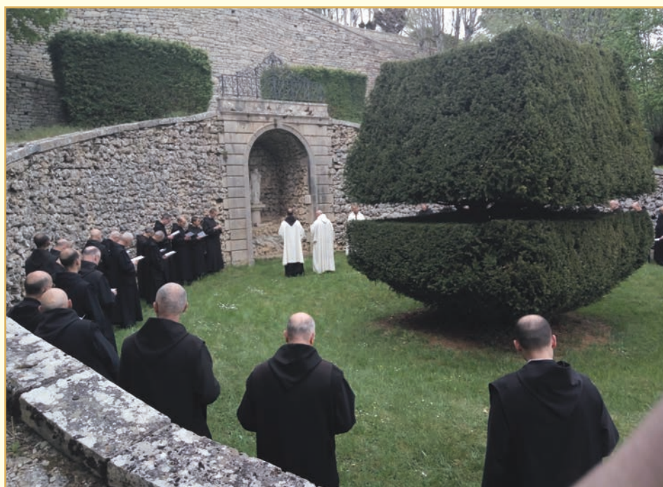
Exvoto a San José

Del 17 al 22 de enero, el padre Louis de Jesús, carmelita de Montpellier, predicó el retiro anual a la comunidad, siguiendo las huellas de los grandes místicos del Carmelo.